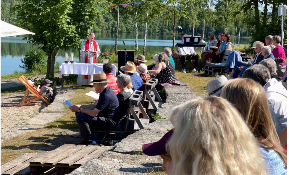
ökumenischer Gottesdienst im Theatron am Murner See, Pfingstmontag